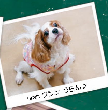
uran ウラン うらん♪