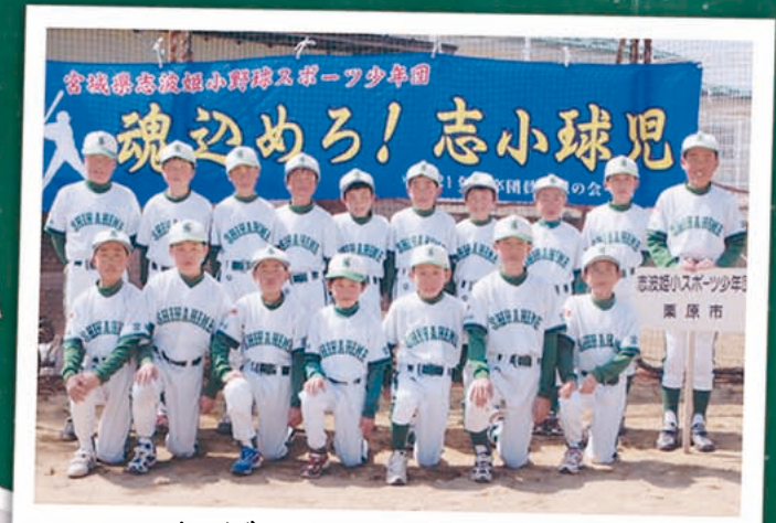
ただいま部員募集中!!