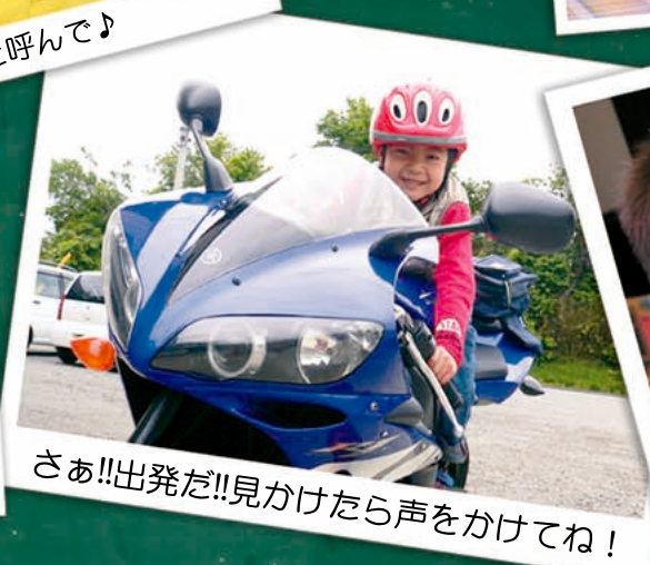
さあ!!出発だ!!見かけたら声をかけてね!