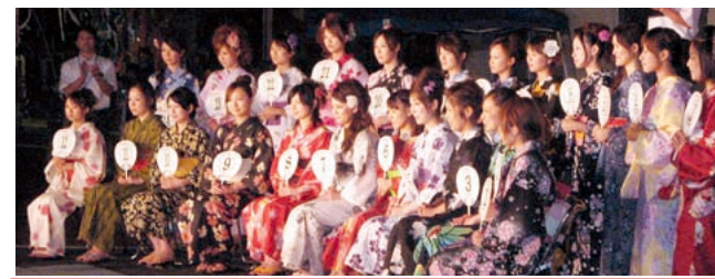
しづはた姫コンテストとは、11月3日文化の日で開催される薬師祭りの主役である北の方幼名「しづはた姫」を決めるコンテストです。

【薬師祭りについて】薬師祭りが近づくにつれて、姫としての自覚が高まってきました。不安もたくさんありましたが、栗原市のみなさんの応援が凄く励みになりました。心から感謝しています。本当にありがとうございました。