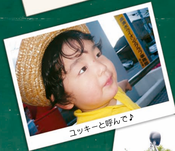
ユッキーと呼んで♪