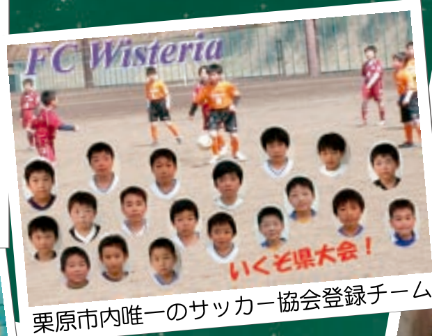
栗原市内唯一のサッカー協会登録チーム