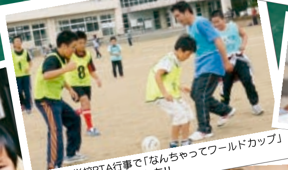
高清水小学校PTA行事で「なんちゃってワールドカップ」 (ミニサッカー)をやりました!!