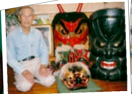
趣味の南部神楽面