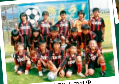
⊕セミネFC Jr.です⊕ みんなで楽しくサッカーしよう!!