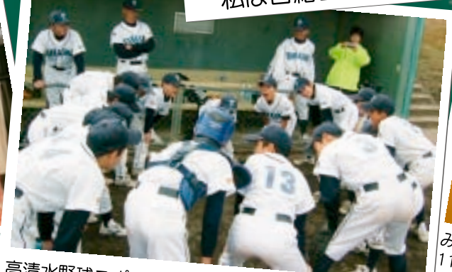
高清水野球スポーツ少年団!!一緒に野球を楽しもう!!