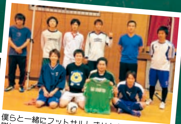
僕らと一緒にフットサルしませんか?? 詳しくはFC. BAD CONDITIONで検索して下さい!!

生まれた子どもを紹介したい 自分の活動をPRしたい 誰かに想いを伝えたい など、内容も年齢も問いません。 ナヌコノ編集部 まで ご応募ください。