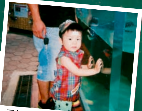
元気で健やかに☆じいより