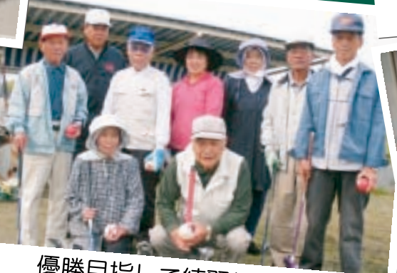
優勝目指して練習してます