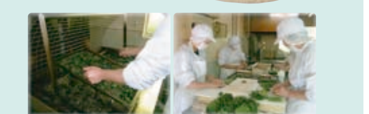
製造工程では従業員が仕事を分担し、流れ作業で進めています。米ぬかから取った約170度の米油で、パリッと揚げています。

仙台味噌を用いた当社特製の甘辛いみそを、新鮮な青シソの葉で1本1本丁寧に巻き上げ、パリッと揚げた手づくりしそ巻きです。ご飯と一緒に食べるのもよし、酒のつまみにも最適な一品です。