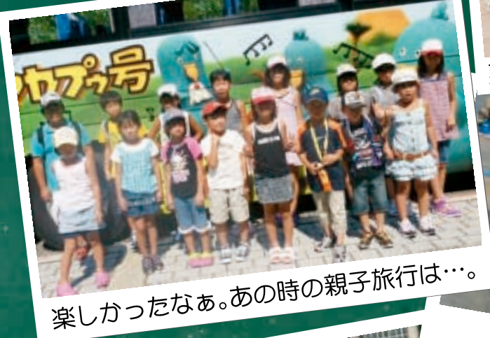
楽しかったなあ。あの時の親子旅行は…。