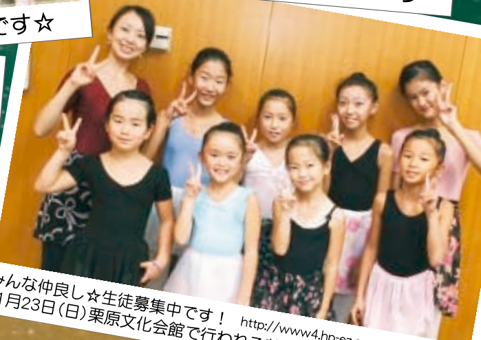
みんな仲良し☆生徒募集中です! 11月23日(日)栗原文化会館で行われる芸能発表会に出演します♪ http://www4.hp-ez.com/dream-create

ナヌコノマガジンは栗原のお店をもっともっと 知っていただく為に作ったフリーマガジンです。 これからも様々なお店の情報を掲載いたします。地域の皆様に愛される紙面を目指します★