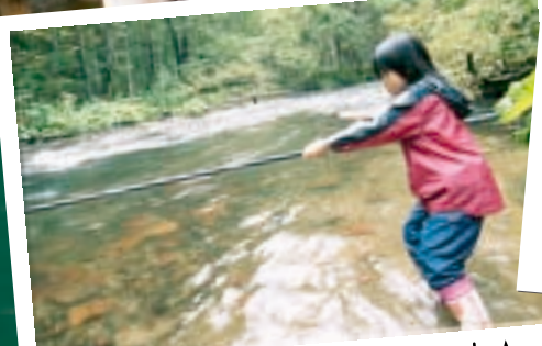
私は自給自足の生活です☆